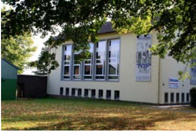
Qualifizierungszentrum Top Vital: Gebäudeansicht von der Otto-Brenner-Straße